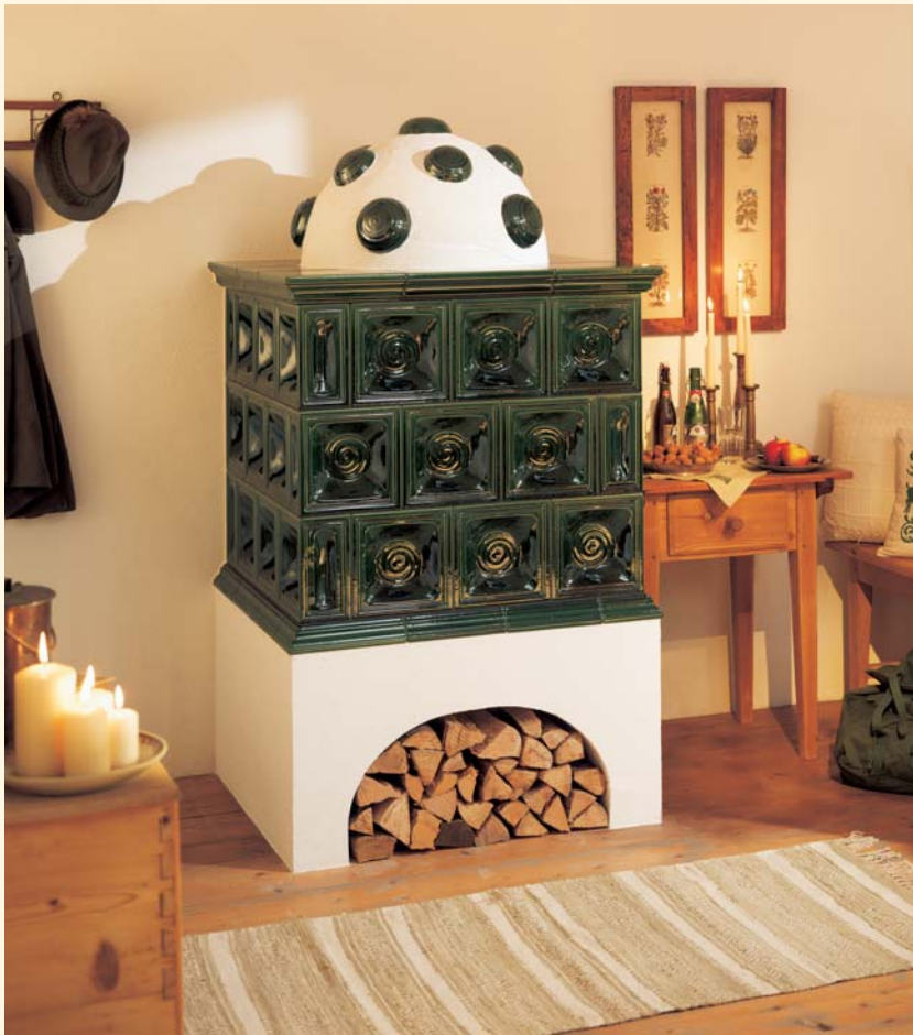
1989: Schüssel-Kacheln K 530 Glasur: Altgrün KE: 217