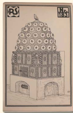
Entwurfszeichnung mit liebevoller Detailarbeit.

Ein Geschenk, das von Generation zu Generation weitergegeben wird.