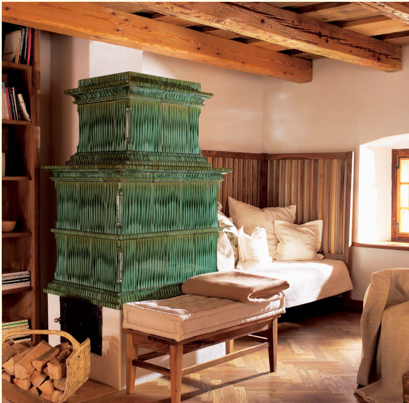
2040: Barock-Kacheln K 239 Glasur: Grün geflammt KE: 421