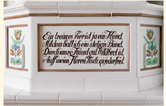
2041: Jagdofen K 510 Glasur: Schmelzweiß und Bunt bemalt KE: 1409

Ein besonderer Kachelofen wird mit den Motiven des Kreuzgangs bemalt. Ein Symbol für die tiefe Verbundenheit mit den christlichen Werten. Auch heute noch werden die Bilder nach den Originalentwürfen des späten fünfzehnten Jahrhunderts gefertigt.