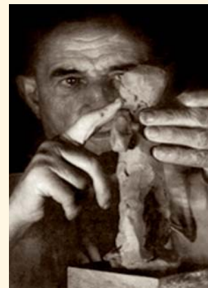
Professor Michael Powolny

Entworfen hat dieses außergewöhnliche Stück Handwerkskunst niemand geringerer als der österreichische Jugendstilkünstler Michael Powolny. Er gilt auch heute noch als der herausragendste Keramikkünstler des Jugendstils. Seine Lehrjahre absolvierte Powolny im Hause Sommerhuber. Michael Powolny war unter anderem Mitbegründer der Wiener Sezession, Gründer und Miteigentümer der Wiener Keramik. Er entwarf für Gmundner Keramik, für Augarten Porzellan und arbeitete fast 30 Jahre mit der Manufaktur Sommerhuber zusammen. Auch heute noch werden die Originalkacheln nach seinen Entwürfen von den alten Modellen hergestellt – wie vor fast hundert Jahren.