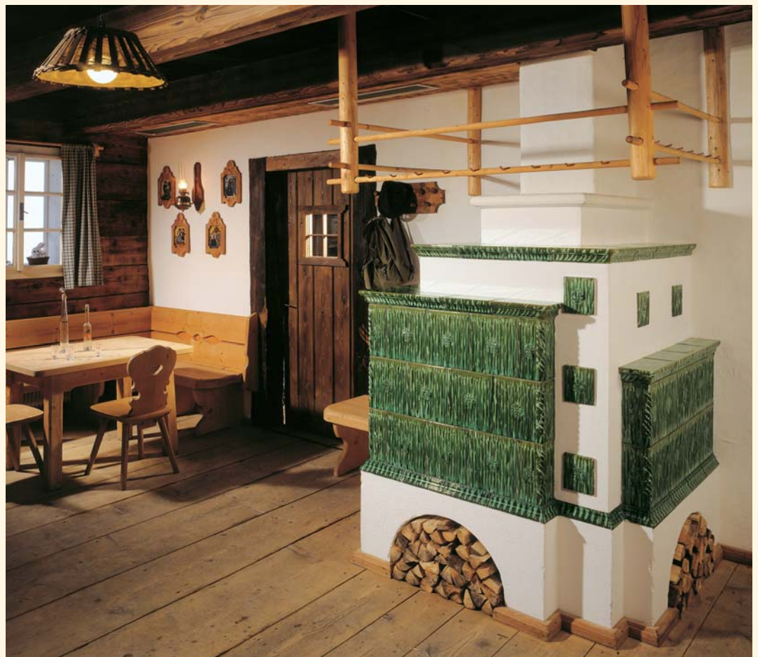
1924: Pfeifen-Kacheln K 138 Glasur: Grün Geflammt KE: 138

An diesen Plätzen wird immer auf besondere Handwerksqualität Wert gelegt. Die Möbel aus massiven heimischen Hölzern, die Form und die künstlerische Gestaltung des Geschirrs und natürlich die Glasur des Kachelofens. Grün ist die Farbe mit der größten Tradition in den alpenländische Stuben. Denn Grün steht seit jeher für Natürlichkeit, Harmonie und Gemütlichkeit.