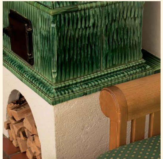
2035: Barock-Kacheln K 239 Glasur: Grün geflammt von 1946 KE: 303

Der Original-Kachelofen von Sommerhuber auf dieser Seite stammt aus den vierziger Jahren des letzten Jahrhunderts und steht im Forsthaus in Sierning. Er ist nur für Experten durch kleine Nuancen in der Farbgebung als Ofen seiner Zeit zu erkennen.