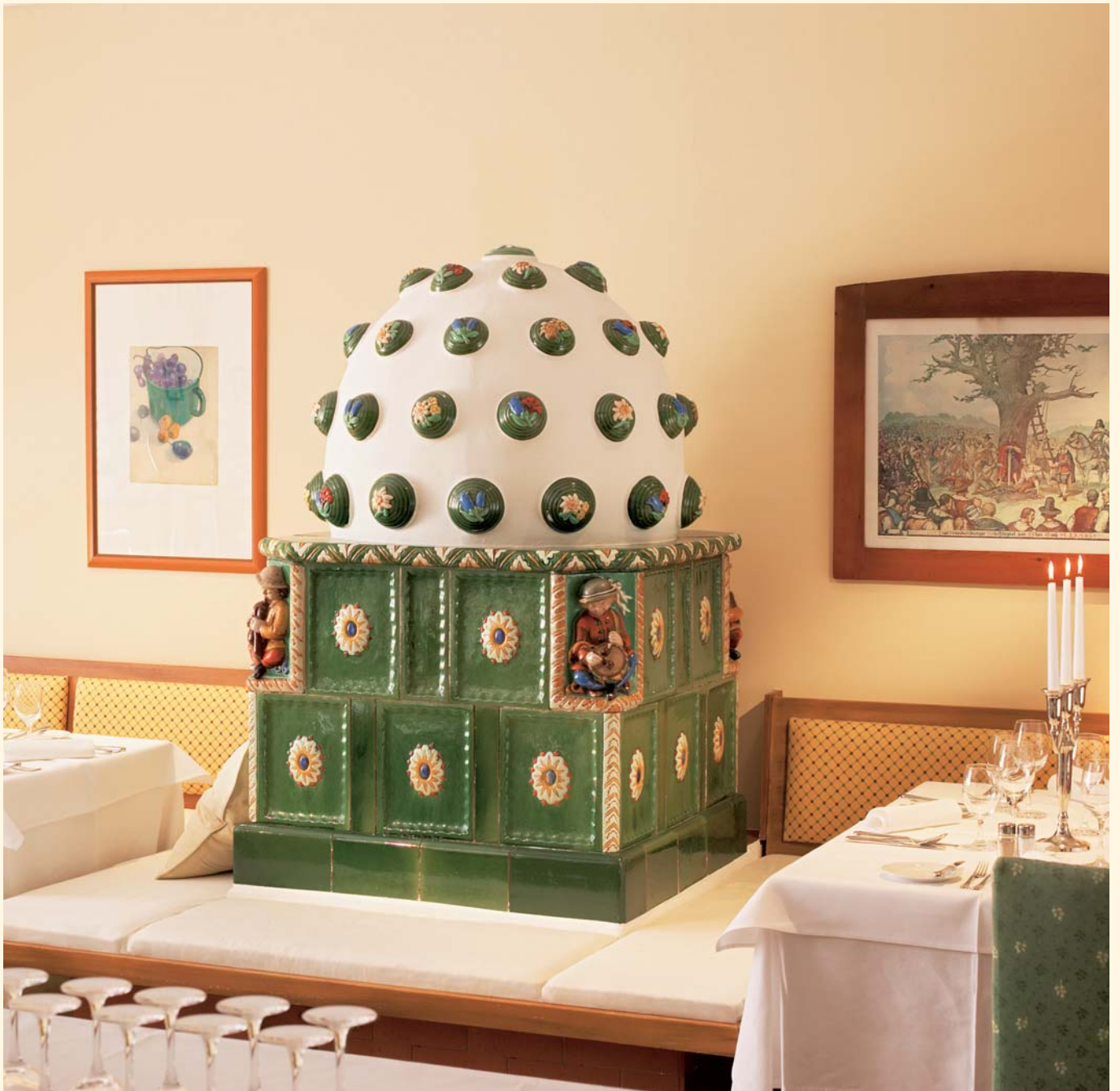
Titel 2036: Barock-Kacheln K 239 Glasur: Grün Geflammt KE: 388