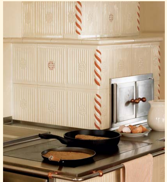
2039: Pfeifen-Kacheln K 138 Glasur: Alabaster KE: 592

Es ist ein besonderes Vergnügen sich bei einem Kachelherd zusammen zu finden und gemeinsam zu kochen. Nach den Rezepten aus Großmutter's Küche. Wenn sich der unvergleichliche Duft des einzigartig knusprigen Brotes, eines saftigen Bratens oder der wunderbaren Weihnachtsbäckerei durch die Stube zieht und einem in eine unvergleichliche Stimmung verbreitet. Ein einzigartiges Gefühl, das ein Sommerhuber Kachelherd ausstrahlt oder besser verströmt.