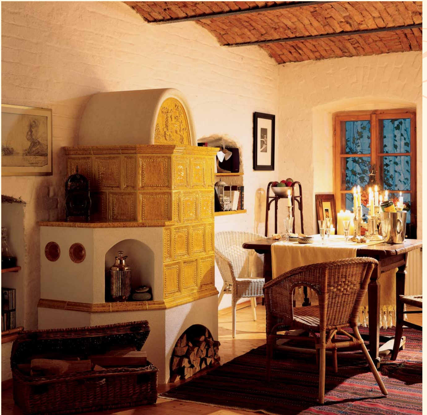
1942: Renaissance-Kacheln K 082 Glasur: Honig KE: 207