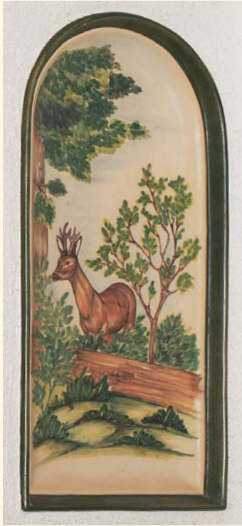
2037: Rahmen-Kacheln K 360 Bogen-Kacheln K 361 Glasure: Jagdgrün und Bunt bemalt KE: 265