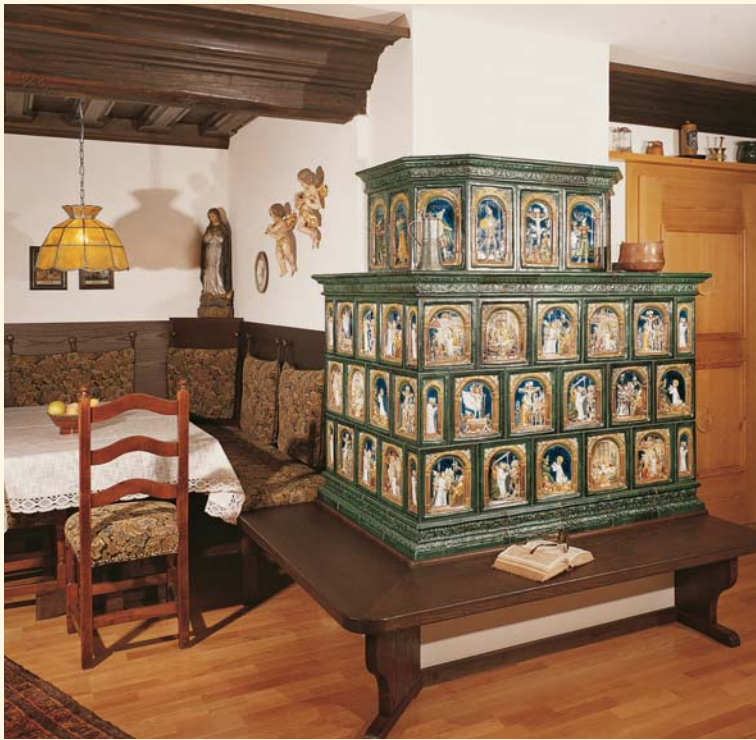
515: Renaissance-Kacheln K 185/187 Glasur: Dunkelgrün Matt und Kräftig bunt bemalt KE: 1288

Ein besonderer Kachelofen wird mit den Motiven des Kreuzgangs bemalt. Ein Symbol für die tiefe Verbundenheit mit den christlichen Werten. Auch heute noch werden die Bilder nach den Originalentwürfen des späten fünfzehnten Jahrhunderts gefertigt.