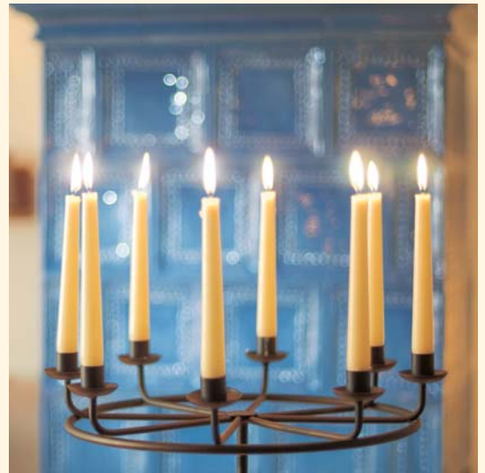
1990: Renaissance-Kacheln K 082 Glasur: Enzian KE: 280

Lebendige Tradition findet jeweils ihre Entsprechung in die heutige Zeit, modern interpretiert. So wie bei den Kachelöfen von Sommerhuber, deren Formgebung sich nicht verändert hat. Diese Kacheln werden seit fünfhundert Jahren unverändert in ihrer Form hergestellt. Nur die Glasuren wurden der modernen Zeit angepasst. Die jahrhunderte alte Geschichte der Keramikmanufaktur in Steyr trägt maßgeblich dazu bei, dass die Herstellung dieser alten Formen auch heute noch möglich ist. Denn bereits im Jahr 1491 fertigt man am Standort von Sommerhuber in Steyr keramische Öfen. Ende des neunzehnten Jahrhunderts war Sommerhuber kaiserlich und königlicher Hoflieferant des Hauses Habsburg Lothringen und des königlichen Hauses Sachsen Coburg Gotha. Neben prunkvollen Schlössern fertigte Sommerhuber in dieser Zeit eine Vielzahl von Kachelöfen für die Sommerresidenzen im Salzkammergut und für herrschaftliche Jagd-anwesen.