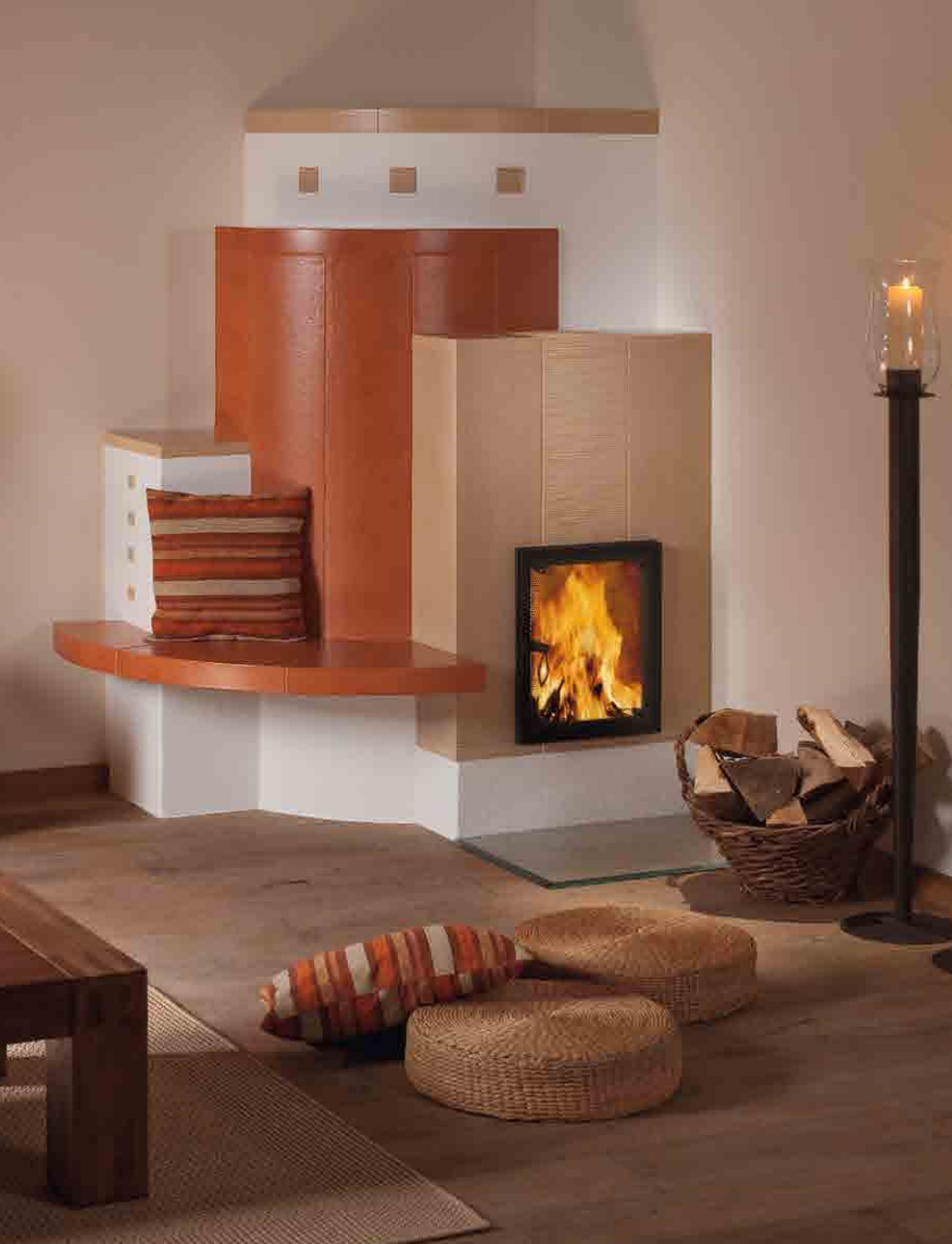
2067: Kachel Ganz Gross 378, Plattsims 178 Glasur: Cognac und Sahara Technik: WGS KE: 255,0