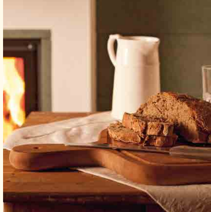
2083: Struktur-Kachel 078 und Bandkachel Piano 386 Glasur: Dunkelgrün matt mit Struktur Terra Technik: Brunner Warmwassertechnik KE: 209,0