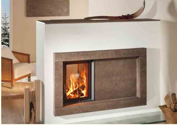
2081_2: Feuerrahmen massiv Rille fein 240, Wandkeramik 224 Glasur: Torf dunkel mit Struktur Terra Technik: Brunner KE: 125,0