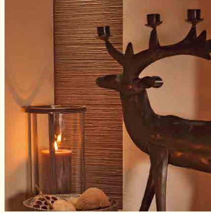
2087: Feuertisch 179, Kachel Ganz Gross 378 glatt und Rille fein, Nische 284 Glasur: Torf dunkel mit Struktur Terra und Düne mit Struktur Terra Technik: Brunner KE: 238,0