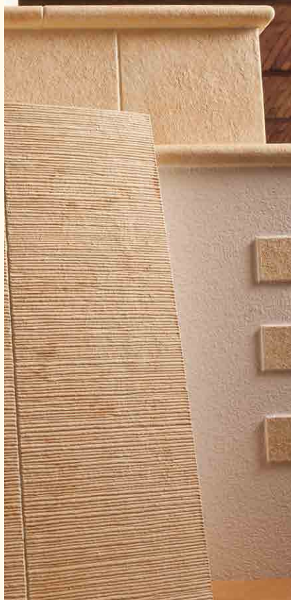
2086: Rückenschild Rille fein und Kachel Ganz Gross 378 Glasur: Solnhofen mit Struktur Terra KE: 420,2