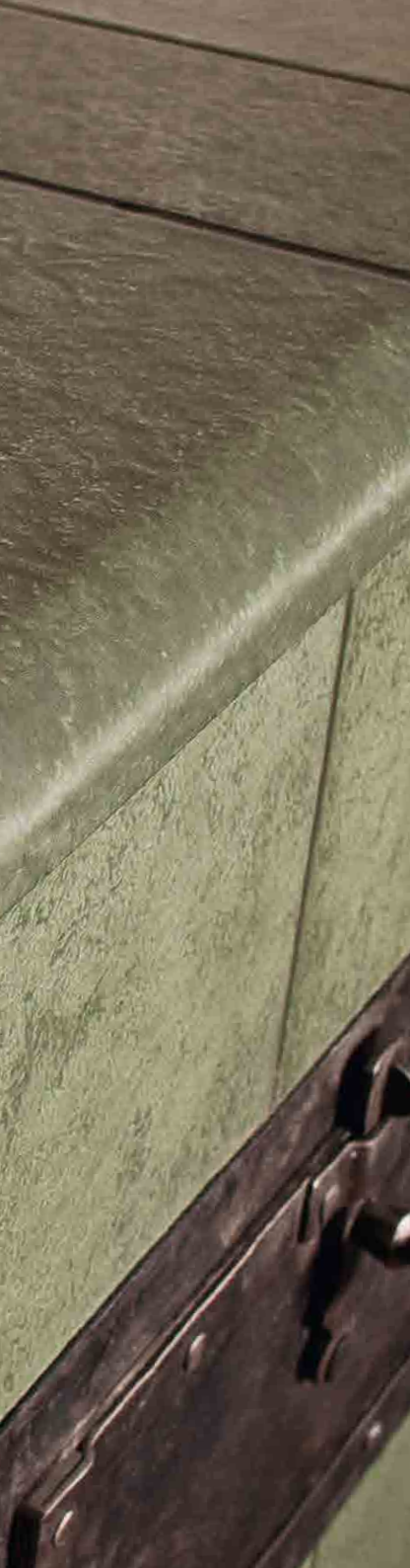
2089: Struktur-Kachel 078 und Nische 284 Glasur: Dunkelgrün matt mit Struktur Terra und Dunkelgrün matt Technik: Gast Schmiedeblick KE: 260,0